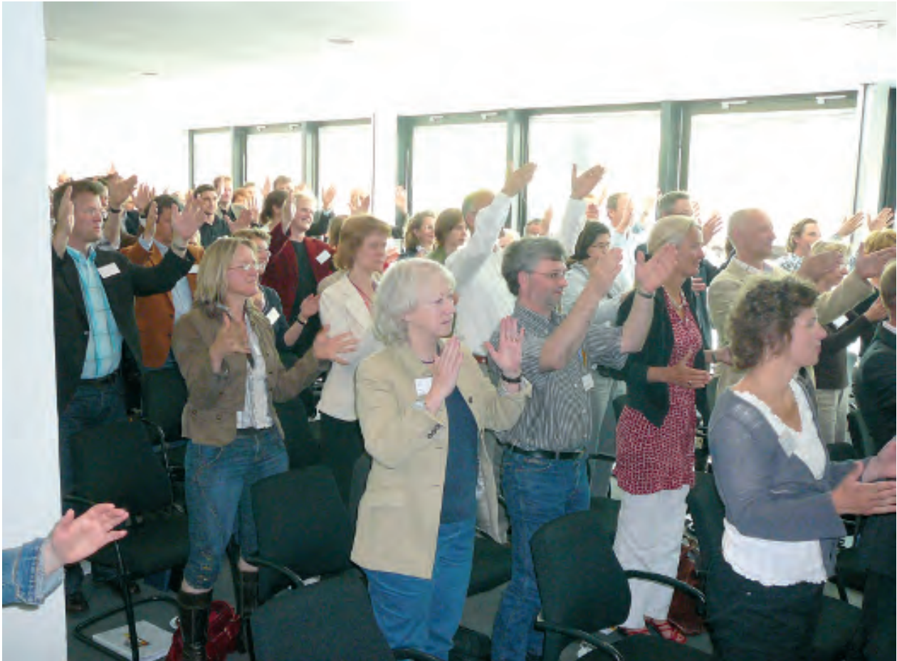
De sfeer tijdens het symposium was goed. Een goochelaar liet zien hoe je mensen enthousiast krijgt.

hand van een treinongeval bekeken welke menselijke invloeden mogelijk een rol hebben gespeeld in het ontstaan van dit ongeval. De ergonoom heeft als specialist op dit gebied beslist een toegevoegde waarde in ongevalsanalyses. Besproken werd verder hoe organisaties met sterk individueel bepaalde invloeden, zoals vigilantie, kunnen omgaan.